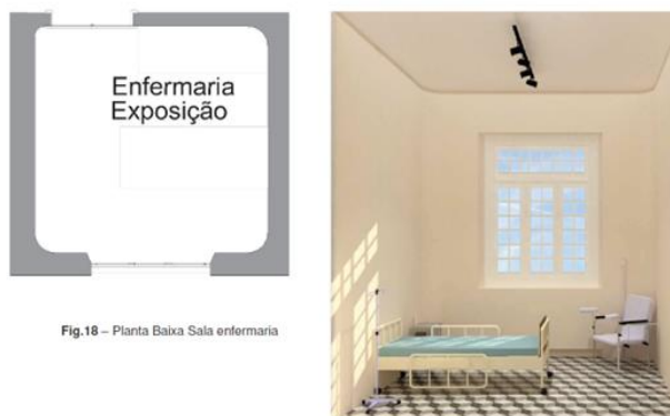
Figura 5: Planta baixa da sala de enfermaria

outros textos sobre o histórico do Museu e do Casarão, entre outros relevantes para a narrativa expográfica.