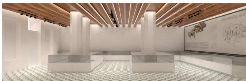
Figura 4: Perspectiva de uma das salas de exposição localizada no porão do Casarão

As exposições são importantes ferramentas de comunicação entre os museus e seus públicos, podendo aproximar e criar laços de identificação. Por ainda não ter um espaço estruturado, o Museu Fármaco Hospitalar ainda não promoveu nenhuma exposição em sua trajetória. Com a finalização do restauro do edifício e a definição dos ambientes internos, será necessário o desenvolvimento de um projeto expográfico para o Casarão. Neste processo deverão ser estipulados os espaços para as exposições de longa e curta duração, a criação de mobiliário expositivo adequado às diferentes tipologias do acervo, a comunicação visual, o design expositivo, as temáticas abordadas na narrativa, entre outros. Destaca-se que para o desenvolvimento deste projeto, a instituição deverá contratar um profissional qualificado.